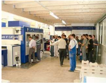
2002 Einweihung des Spritzautomaten für eine professionelle Oberflächenbehandlung.