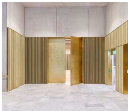
2021 Übergrosse Sicherheitstüren für die Ewigkeit – für das Kunsthhaus in Zürich.