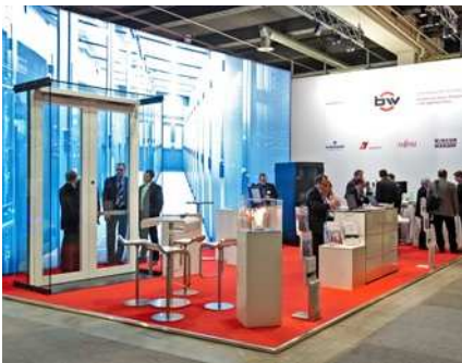
2011 Erstmalige Präsentation von Türen mit Venenscannern an der Sicherheitsmesse in Zürich.