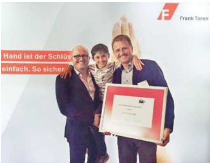
2016 Anerkennungspreis vom SVC Zentralschweiz für unser innovatives Schaffen.