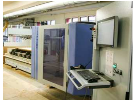
2018 Erste CNC-Maschine mit automatischem Bestücker in Betrieb genommen.