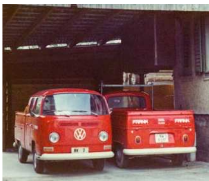
1971 Unsere erste Fahrzeugflotte. Gestartet mit dem Kontrollschild NW 7.