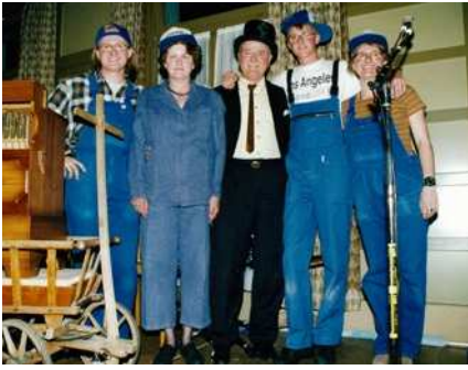
1997 Die dritte und vierte Generation am 100-jährigen Firmenjubiläumsfest in der Krone, Buochs.