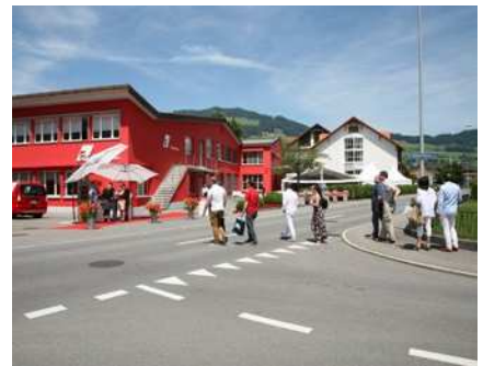
2015 Büroumbau-Abschlussfest mit Nachbarn, Kunden und Lieferanten.