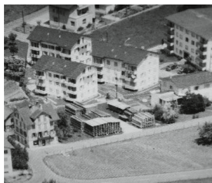
1960 Früher hatten wir unser Holzlager noch draussen an der heutigen Mühlemattstrasse.