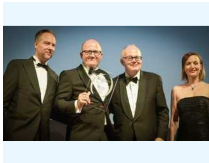
2017 Auszeichnung von EY als zweitbestes Familienunternehmen der Schweiz.