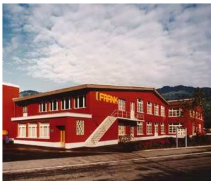
1985 Unser Betriebsgebäude von 1985 – ein Extrafoto für den ersten Hochglanz-Prospekt.