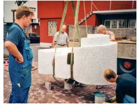
2003 Unser Brunnen, ein Symbol für unseren tief verankerten Bewegungsdrang, wird montiert.